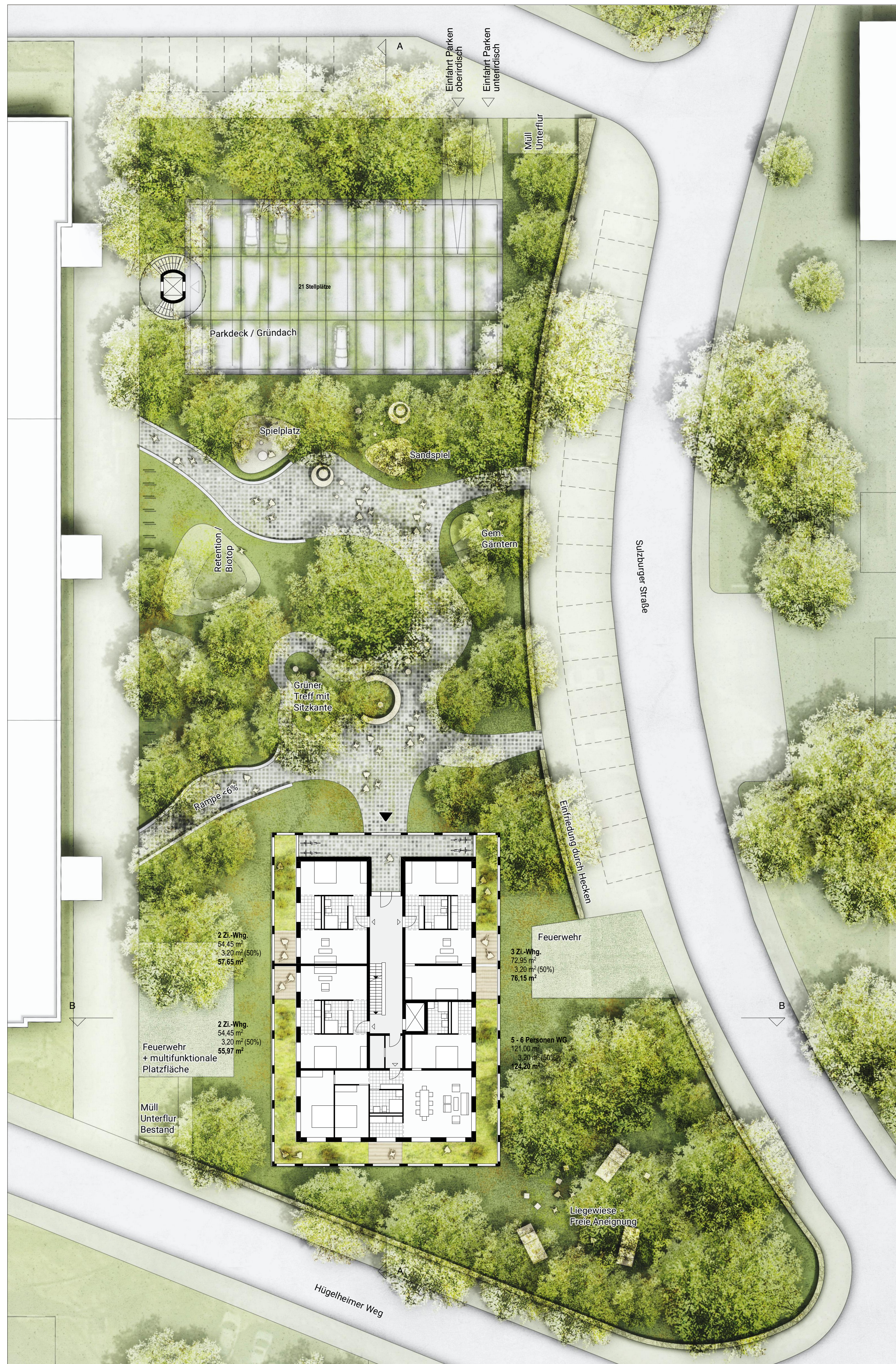
Teil B - Erdgeschoss M. 1:200