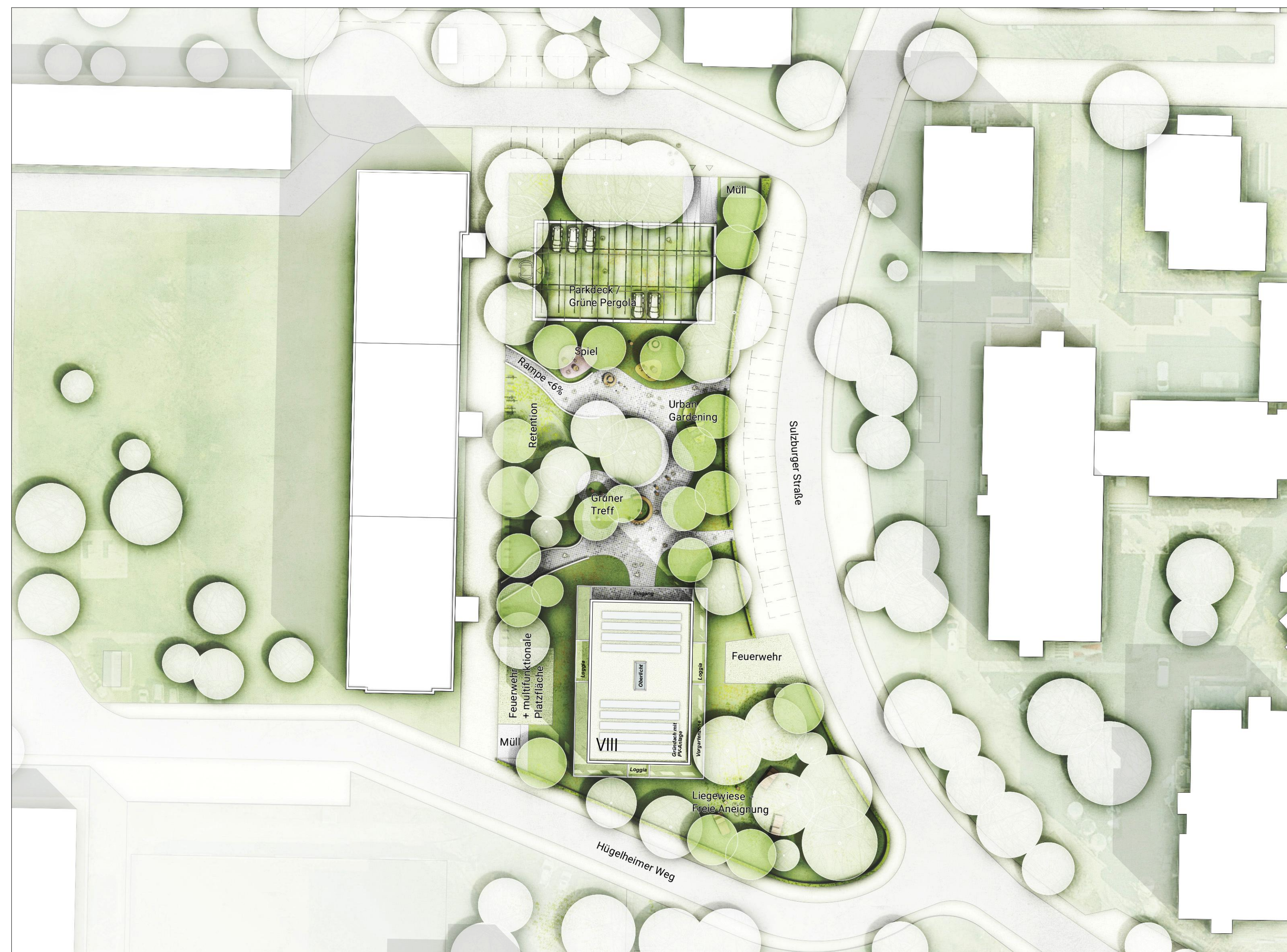
Teil A - Lageplan M. 1:500