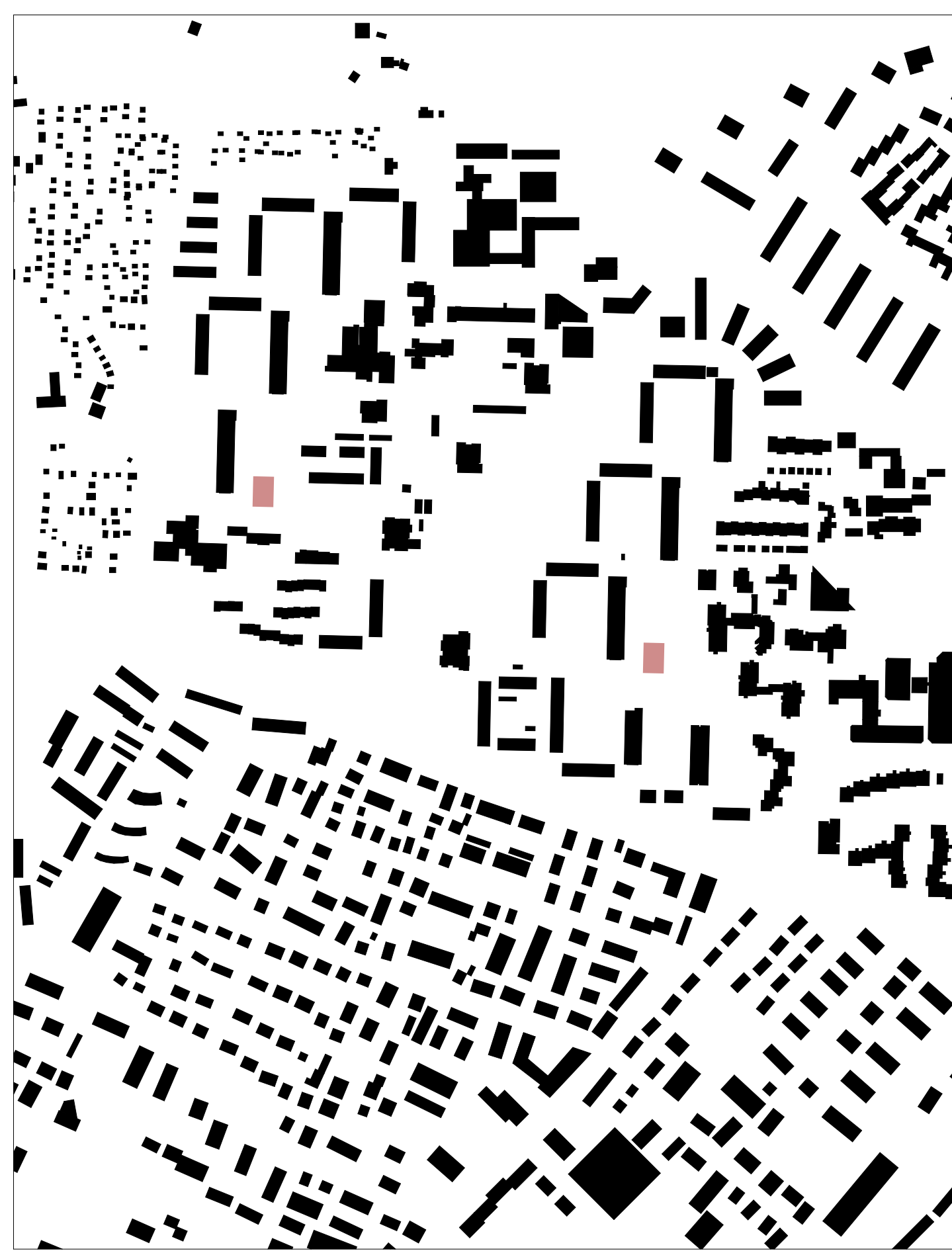
Schwarzplan M. 1:5000

Die konstruktive Logik der modularen Bauweise spiegelt sich in der Gestaltung der Fassade wider. Sich wiederholende Fensterformate rhythmisieren den Baukörper. Vor- und Rücksprünge in Form von Fensterfaschen verstärken die plastische Wirkung des Baukörpers, dessen expressive Farbigkeit einen Kontrast zur Nachbarbebauung schafft.