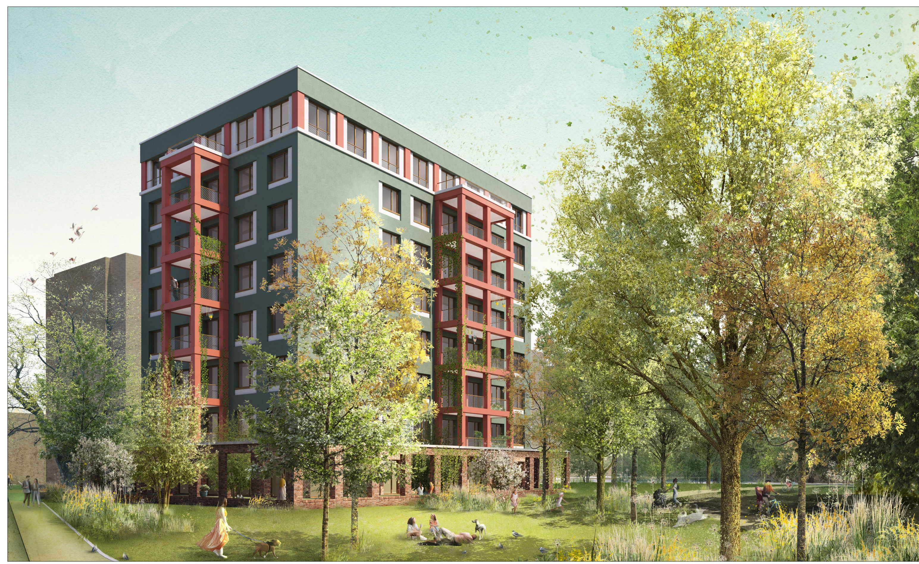
Perspektive Ecke Hühelheimer Weg / Sulzburger Straße